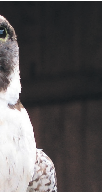
Abhilfe schaffen.